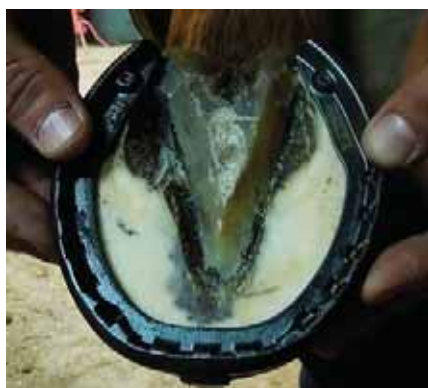
Razerskon håller Babyflos hovar starka

och red till slut barfota för att vi hade så mycket skador och problem med underlaget. Min märr behövde något som stabiliserade och balanserade