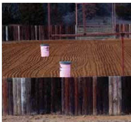
Fallons träningsbana hemma i Whitesboro, Texas

Barrel racing ser inte så svårt ut – man bara springer så fort man kan runt tre tunnor, eller hur? Men disciplinen är faktiskt mer teknisk än det kan verka: en lyckad runda kräver att många komponenter i ens kunskaper i horsemanship kommer samman för att möjliggöra för ett Barrel racing team att spika dessa tre sträckor i hög hastighet. Men även när det görs på rätt sätt, vad som ser ut som ett enkelt jobb på hästryggen är fortfarande en av de mest farliga western disciplinerna. En häst kan snubbla i full fart, häst eller ryttare kan kollidera med ett fat, under en sväng med dåligt underlag kan hovarna glida rätt ut från hästen.